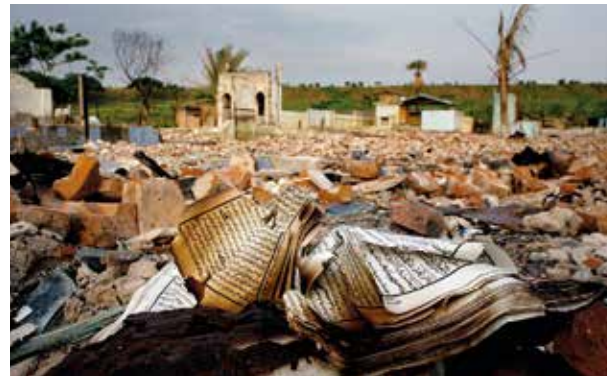
Myanmar (Burma): Buddhistische Mönche rufen zur gewaltsamen Vertreibung der muslimischen Minderheit auf.