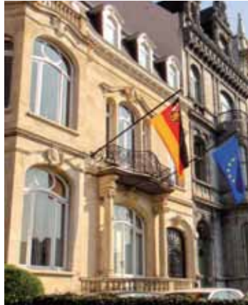
Die Vertretung des Landes Rheinland-Pfalz in der Avenue de Tervuren in Brüssel.

Zur wirksamen Interessenvertretung gehört die Herstellung und Pflege von Kontakten und Netzwerken , sei es mit den Europaabgeordneten und Vertretern der übrigen EU-Institutionen, sei es mit Regionalbüros sowie den in Brüssel ansässigen zahlreichen Vereinigungen und Verbänden der Zivilgesellschaft. Die Landesregierung pflegt in Europafragen in besonderer Weise den Kontakt zu den Kommunen und Landkreisen, den Wirtschafts-, den Sozialpartnern, den kleinen und mittleren Unternehmen und zu den Bürgerbewegungen und unterstützt sie in ihren Anliegen gegenüber der europäischen Politik.