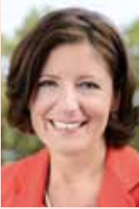
Malu Dreyer, Minister- präsidentin von Rheinland-Pfalz

„Zusammen sind wir Europa“ lautet das Motto, unter dem Rheinland-Pfalz die europäische Integration mitgestaltet. Unser Land ist durch seine geografische Lage und seine Geschichte mit den anderen europäischen Regionen und Staaten Europas in besonderer Weise verbunden. Mit Grenzen zu Frankreich, Belgien und Luxemburg ist die Europäische Union in Rheinland-Pfalz gelebter Alltag. Auch für viele Studierende und junge Menschen ist die Europäische Integration mittlerweile eine Selbstverständlichkeit. Die mittelständische Wirtschaft in Rheinland-Pfalz (wie auch in Deutschland) ist besonders auf die innereuropäischen Exporte angewiesen. Ohne eine europäische Mitfinanzierung wären viele Projekte der ländlichen Entwicklung, der Agrarpolitik, der Wirtschafts-, Infrastruktur- oder der Arbeitsmarktförderung nicht möglich. Politisch arbeitet das Land in der Großregion, der Oberrheinregion und im PAMINA-Raum mit, genauso im Ausschuss der Regionen.