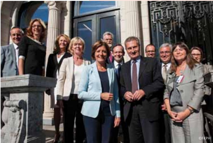
Der rheinland-pfälzische Ministerrat mit EU-Kommissar Günther Oettinger bei einem Treffen in der Landesvertretung Rheinland-Pfalz in Brüssel.

rahmen für die Europäischen Union für die Jahre nach 2020, die Zukunft der wichtigen europäischen Programme, von denen das Land profitiert, wie z.B. EFRE, ELER, ESF und Interreg, aber auch die Direktzahlungen in der Landwirtschaft sowie Direktprogramme im Bereich der Forschung wie Horizon 2020 oder der Bildung wie Erasmus+. Daneben bündelt der Plan diverse fachpolitische Anliegen, beispielsweise in den Bereichen europäische Steuerpolitik, Digitalisierung, aber auch Katastrophenschutz.