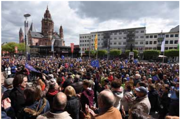
Am 30. Mai 2017 demonstrierten zahlreiche Bürgerinnen und Bürger auch in Mainz bei einer „Pulse of Europe“-Veranstaltung für ein vereintes Europa.

Frankreich und Deutschland können bei der Weiterentwicklung und der Integration der Europäischen Union eine Vorreiterrolle einnehmen.