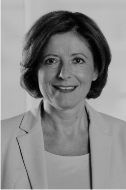
Ministerpräsidentin Malu Dreyer, Bild: Elisa Biscotti / © Staatskanzlei

Grundgesetz und Landesverfassung bilden die rechtliche Grundordnung des Staates und beschreiben das Wertefundament unseres Gemeinwesens. Die Verfassung legt als Grundnorm die Leitprinzipien fest, nach denen staatliche Macht ausgeübt werden darf, etwa das Demokratie- und das Rechtsstaatsprinzip.