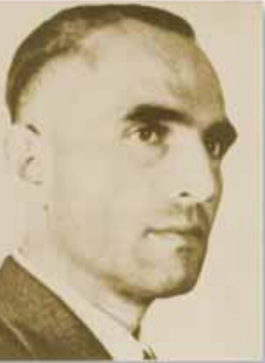
Werner Best, au milieu des années 30