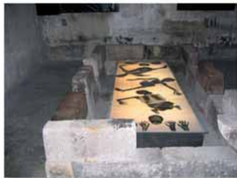
L'installation «La fosse» de l'artiste Fee Fleck

tration de Osthofen, grâce à six panneaux d'information répartis sur le site, qui relatent les événements et expliquent l'importance que revêt chacun de ces six endroits pour l'histoire du camp. En complément de l'exposition permanente, les visiteurs individuels peuvent également travailler sur un des six ordinateurs se trouvant dans la «station de travail approfondi» afin d'obtenir d'autres