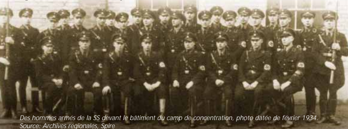
Des hommes armés de la SS devant le bâtiment du camp de concentration, photo datée de février 1934.

Au cours des débats et de la lutte pour le pouvoir qui ont bouleversé la Hesse en automne 1933, le Gauleiter et Gouverneur