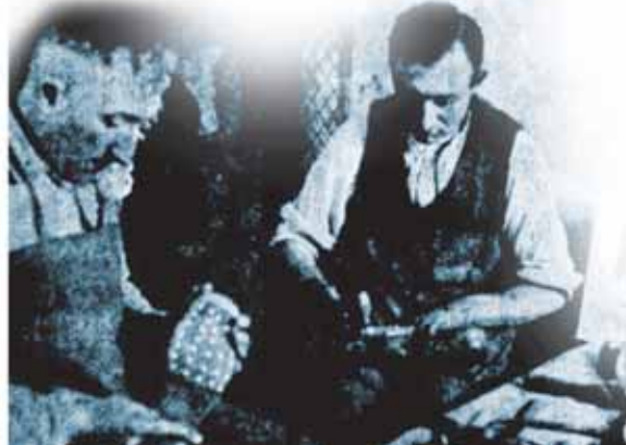
La cordonnerie du camp de concentration de Osthofen; photo de presse, parue dans l'édition du 23 et 24 avril 1933 de la «Niersteiner Warte».

Pour affronter les actes de violence arbitraires commis par les gardiens, les détenus essayaient de s'entraider autant qu'ils le pouvaient. Ainsi, ils apportaient en cachette des vivres complémentaires dans le camp II pour aider ces détenus qui souffraient beaucoup de la faim due à des rations bien frugales. D'autres détenus ayant attiré sur eux une «attention» particulière des gardiens, ont été proposés avec succès à Otto Krebs, responsable SS des commandos de travail en dehors du camp. De cette manière, ils