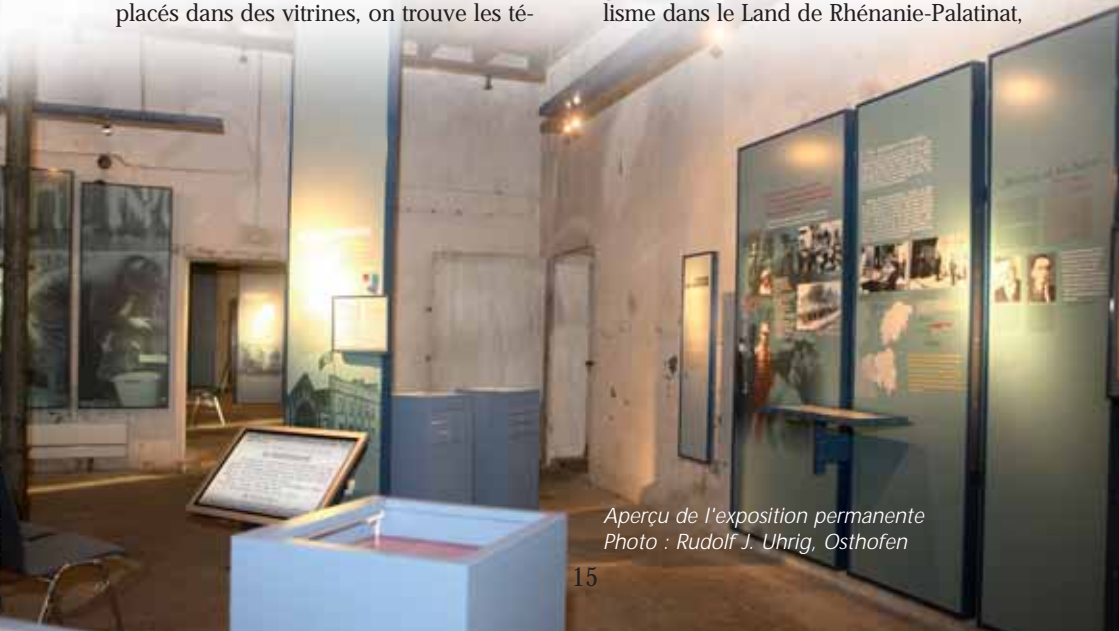
Aperçu de l'exposition permanente

Le Centre de documentation sur l'époque du national-socialisme de la Rhénanie-Palatinat, au sein du mémorial du camp de concentration de Osthofen, est à la fois un lieu de mémoire, de documentation et de recherches ainsi que de transmission pédagogique relative à l'époque du national-socialisme dans le Land de Rhénanie-Palatinat,