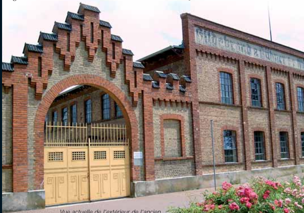
Vue actuelle de l'extérieur de l'ancien camp de concentration de Osthofen

à Osthofen, petite commune rurale située à proximité de la ville de Worms, un camp de concentration pour l'Etat populaire de la Hesse comprenant la Hesse rhénane, Starckenburg et la région Oberhessen. Toutes les personnes arrêtées pour des raisons politiques, dont la garde à vue devait durer une semaine ou plus, ont dû être transférées dans ce camp.