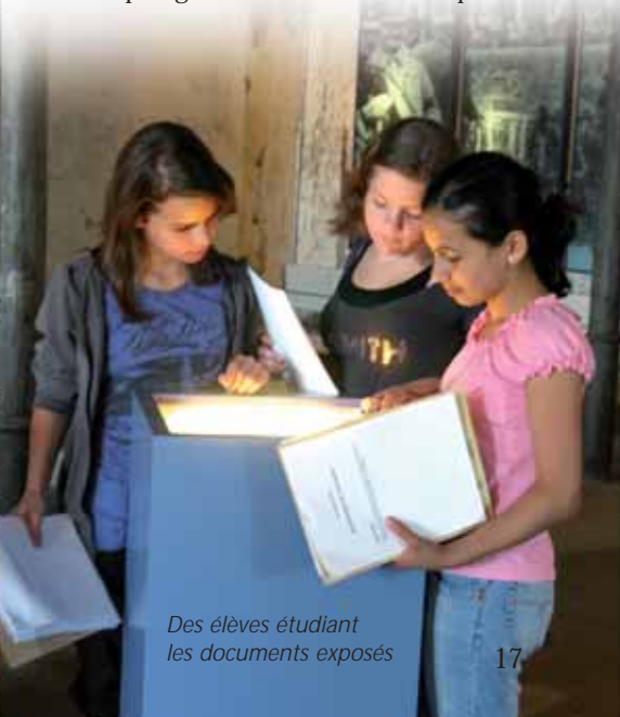
Des élèves étudiant les documents exposés

Une approche tout à fait différente de la thématique s'offre aux visiteurs grâce aux œuvres d'art qui se trouvent sur le site du mémorial du camp de concentration de Osthofen. C'est en effet par ce biais que le lieu de l'ancien camp de concentration devient accessible et concret, même si l'on n'a pas les connaissances préalables spécifiques de l'histoire. La sculpture constitue le point fort de ces objets d'art au mémorial. En 1990 déjà, c'est-à-dire avant le début des travaux de rénovation du site et avant son aménagement comme mémorial, l'artiste Friedhelm Welge de Francfort y a installé son atelier pendant plusieurs semaines pour créer entre autres la sculpture «Sich Windender» (= Celui qui se tord) que l'on peut voir depuis sur le site du mémorial.