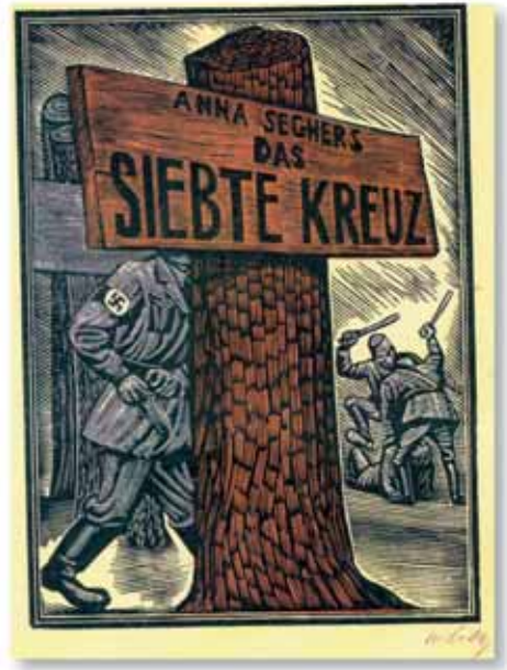
Gravure sur bois du Mexicain Leopoldo Méndez ; elle figure sur la couverture de la première édition en allemand du roman « La Septième Croix » de Anna Seghers, publié en 1942 aux Editions El Libro Libre, Mexico.

en majorité des Belges, ont dû y effectuer du travail obligatoire, entre décembre 1942 et mars 1945.