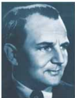
Carlo Mierendorff

En tant qu'adversaire déterminé des nationaux-socialistes Carlo Mierendorff, attaché de presse au ministère de l'Intérieur de la Hesse et député SPD au Reichstag, a été arrêté pour la première fois le 7 mars 1933; ensuite il a été renvoyé de son poste dans la fonction publique. Après un bref séjour en Suisse, des agents de la Gestapo l'ont arrêté le 13 juin 1933 lors d'une réunion de conspirateurs à Francfort s/Main avant de le transférer à Osthofen le 21 juin. «Voilà le type qui a trahi les ouvriers!» Tels étaient les propos de la SS de Darmstadt au moment où ils sont arrivés avec lui à Osthofen. Pendant la première nuit, Mierendorff a été roué de coups et maltraité à tel point que le lendemain, il ne pouvait pratiquement plus bouger. Il avait même de graves difficultés à parler. Pour cette raison, il a dû passer plusieurs semaines au «Revier». Après l'avoir quitté, il