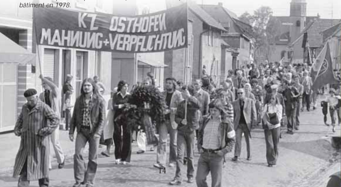
Une des trois excursions pour la paix organisées par la branche jeunesse du syndicat allemand DGB et par l'Amicale des anciens détenus du camp de concentration de Osthofen.

Depuis 2002, le département «travail de mémoire» et le Centre régional de documentation sur l'époque du national-socialisme en Rhénanie-Palatinat – deux structures de la Centrale régionale de formation politique – ont leur siège dans l'enceinte du mémorial. Une fois que les travaux d'aménagement de ce site étaient achevés, on a pu procéder, en mai 2004, à l'inauguration de l'exposition permanente qui porte le titre «Persécution et