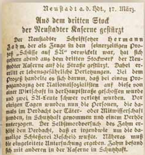
Verzweigungstat des Hermann Zahm, Artikel aus dem Pfälzischen Kurier vom 18. März 1933 (Stadtarchiv Neustadt)

im Jahr 1992. Ab 1993 nutzte die Landesregierung die leer stehenden Gebäude als Aufnahmeeinrichtung und Unterkünfte für Asylsuchende und Kriegsflüchtlinge. Im Januar 2000 wurde das markante Gebäudeensemble der „Caserne Turenne“ als bauliche Gesamtanlage unter Denkmalschutz gestellt und privatisiert. Inzwischen sind auf der 200.000 qm großen Konversionsfläche ein landwirtschaftlicher Großbetrieb und die Verwaltung der Hornbach Holding AG ansässig. Der Holding war beim Kauf der Kaserne das „dunkle“ Kapitel der Gebäudegeschichte nicht bekannt. Dies lag auch daran, dass bis Ende der neunziger Jahre in Neustadt keine von städtischer Seite betriebene Aufarbeitung der NS-Geschichte stattfand, obwohl die Stadt für einige Jahre Sitz des pfälzischen Gauleiters Josef Bürckel und damit auch vieler Parteien und Behörden war. Dennoch übernahm der neue Eigentümer in vorbildlicher Weise Verantwortung und unterstützte das „Projekt Gedenkstätte“ von Anfang an.