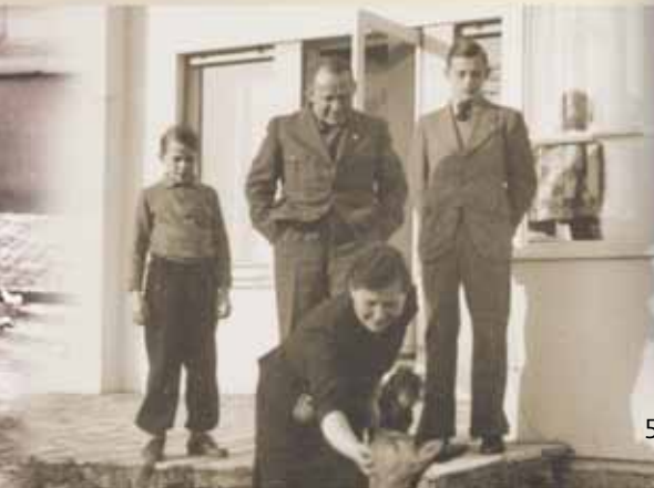
Gauleiter Josef Bürckel mit Familie

im Jahr 1992. Ab 1993 nutzte die Landesregierung die leer stehenden Gebäude als Aufnahmeeinrichtung und Unterkünfte für Asylsuchende und Kriegsflüchtlinge. Im Januar 2000 wurde das markante Gebäudeensemble der „Caserne Turenne“ als bauliche Gesamtanlage unter Denkmalschutz gestellt und privatisiert. Inzwischen sind auf der 200.000 qm großen Konversionsfläche ein landwirtschaftlicher Großbetrieb und die Verwaltung der Hornbach Holding AG ansässig. Der Holding war beim Kauf der Kaserne das „dunkle“ Kapitel der Gebäudegeschichte nicht bekannt. Dies lag auch daran, dass bis Ende der neunziger Jahre in Neustadt keine von städtischer Seite betriebene Aufarbeitung der NS-Geschichte stattfand, obwohl die Stadt für einige Jahre Sitz des pfälzischen Gauleiters Josef Bürckel und damit auch vieler Parteien und Behörden war. Dennoch übernahm der neue Eigentümer in vorbildlicher Weise Verantwortung und unterstützte das „Projekt Gedenkstätte“ von Anfang an.