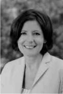
Ministerpräsidentin Malu Dreyer

Grundgesetz und Landesverfassung regeln die rechtliche Grundordnung des Staates und schreiben das Wertefundament unseres Gemeinwesens fest. In der Verfassung als höchster Rechtsnorm werden die Leitprinzipien bestimmt, nach denen staatliche Macht ausgeübt werden darf, etwa das Demokratie- und Rechtsstaatsprinzip. Sie hat die grundlegenden gesellschaftlichen Wertentscheidungen zu treffen, beispielsweise die Unantastbarkeit der Würde des Menschen.